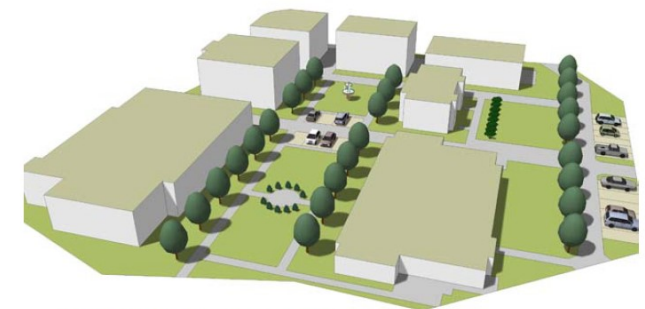
Projekt Bad Kösen

Fr. 14.06.2024 in Köln Sem. Nr. 24 210 B